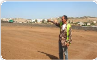
عامل في مكب جبارة الذي يجري العمل به لتحويله إلى حديقة خضراء